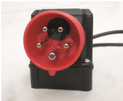
Abb. 6 Phasenwender.

Nehmen Sie einen handelsüblichen Schraubendreher und positionieren Sie ihn wie in Abb. 7 zu sehen ist im schwarzen Schlitz des Phasenwenders. Nun drehen Sie ihn um 180°.