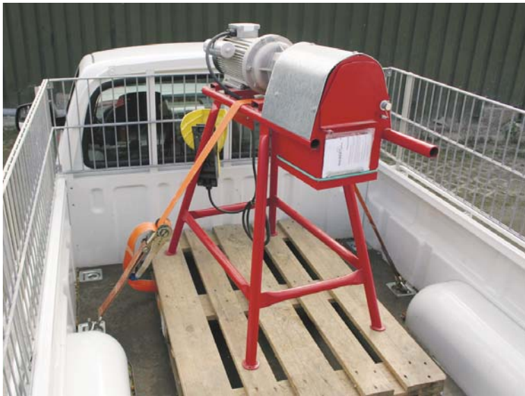
Abb. 1 Gesicherte Wacker Putz- und Fräsmaschine auf einem KFZ.

Beachten Sie unbedingt § 22 der StVO (Versender und Fahrer haften).