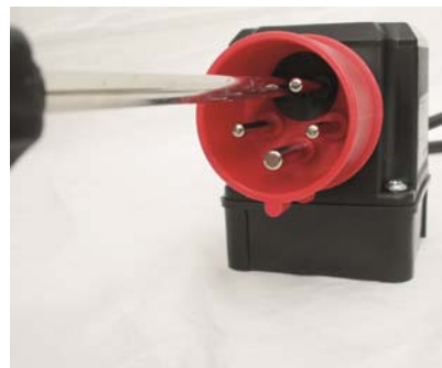
Abb. 7 Phasenwender mit Schraubendreher in Position.