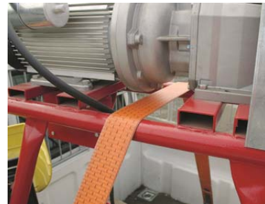
Abb. 2 Position des Zurrgurtes zur Sicherung.

Schrauben Sie alle 4 Füße des Maschinengestells (Bohrungen vorhanden) auf einer unbeschädigten Holzpalette z.B. einer Europalette fest. Siehe Abb. 1.