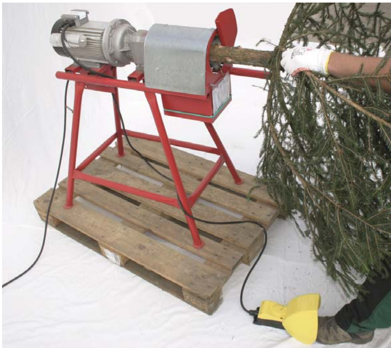
Abb. 3 Anfräsvorgang eines Weihnachtsbaumstammes.